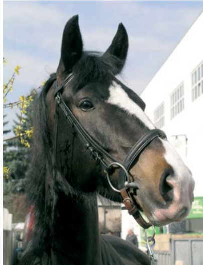
Gerderlandský kůň - klisna Vida

S velkým temperamentem na kolbišti doslova vletěla tmavá klisna Vida, Gerderlandský kůň, jediná zástupkyně tohoto plemene v ČR, importovaná z Nizo-