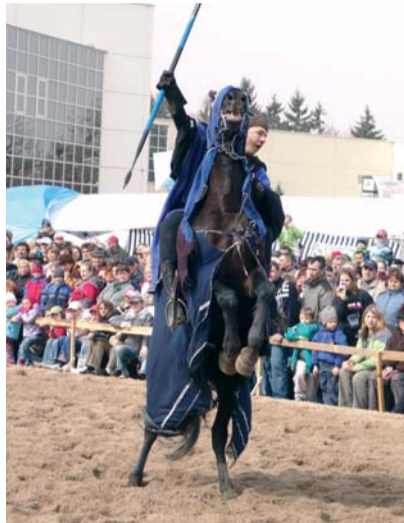
Co umí takový americký klusák...

Výstaviště se nachází jen pár kroků od vlakového nádraží, takže opravdu není možné se ztratit. Díky perfektnímu vlakovému spojení jsem se do-