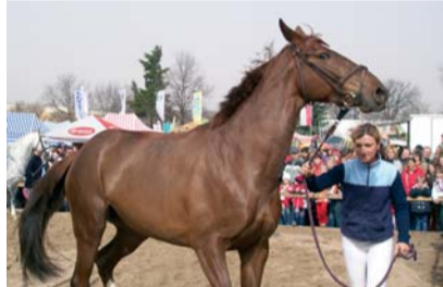
Český teplokrevník - klisna Riva

Na venkovní ploše probíhal dvakrát denně týž doprovodný program, který na hodinu a půl naplno zaměstnal téměř všechny přítomné a ačkoli uvedené časy pro start programu byly spíše orientační, trpělivě vyčkali všichni. Vyplatilo se. Odměnou nám bylo krásné přivítání v roli dvou hermelínových noriků Orfea a Romea v zápleti, které těsně následoval pan Sádlo se svými miniaturními poníky – kdo někdy navštívil v Lysé koňskou výstavu, jistě ho zde viděl, neboť pan Sádlo nevynechá jedinou příležitost a věrně se sem vrací. A jeho konci jako by se snad pro předvádění narodi-