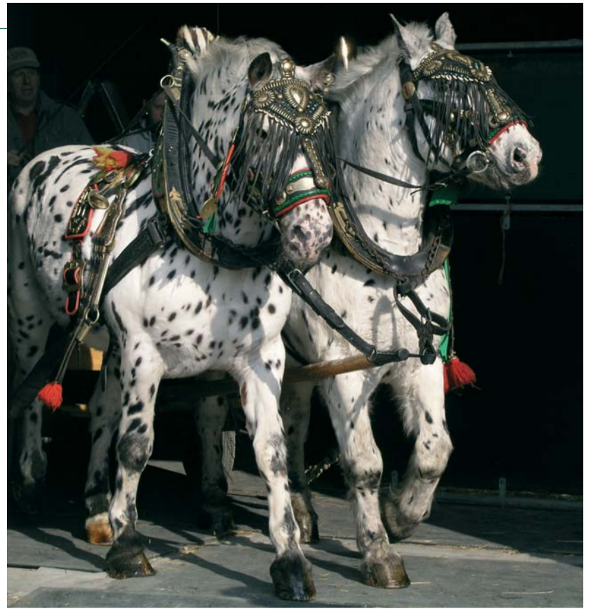
Noričtí hřebci Romeo a Orfeus

zemí. Že jde o doopravdy výjimečného koně jsme se mohli přesvědčit později u boxů – zatímco ostatní koně se mrzutě