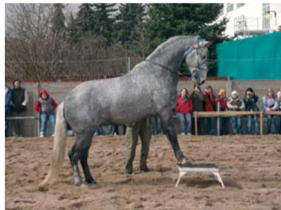
Lipický hřebec Darius

zemí. Že jde o doopravdy výjimečného koně jsme se mohli přesvědčit později u boxů – zatímco ostatní koně se mrzutě