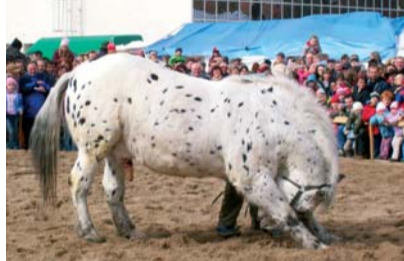
Norik Orfeus

počínaje traktory konče. A jelikož do zemědělství vždy patřili koně, pospíchala jsem davem k předvádění vzadu. K malému rozčarování koňáků tam, kde očekávali plochu pro koně, stály poněkud netematické stánky typu „Vše za 39“. Až za tím se v rohu krčilo pískové kolbiště, oproti tradičnímu zmenšené více než na polovinu.