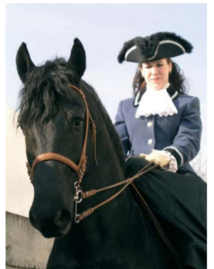
Dámy v sedle

Ve chvílích mezi programem se lidé roztrosili po areálu, kde na ně čekalo nepřeberné stánků s všemožnými zemědělskými a jezdeckými potřebami, oblečením, jídel... velké fronty se tvořily před boxy koní a před trenážerem cválajícího koně z Jockey clubu, kterého si zkoušely především menší děti... obrovský dav tekoucí sem a tam završovaly lonžovací bičky a okrasné stromky pochůzející v davu, jezdecké přílby v podpaží psýných dětí, květky a perníky – zkrátka výstavní slevy spolehlivě nalákaly všechny návštěvníky.