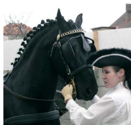
Fríský kůň

Zpátečními vlaky do hlavního města tak odjížděly celé hory jezdeckých potřeb, inspirace, co všechno s těmi „našimi“ koníky vlastně můžeme dělat, příjemná únava a hlavně radost z příjemně stráveného dne.